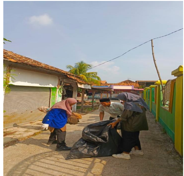
Gambar 6. Suasana Gerakan Sadar Lingkungan Bersama Mahasiswa dan Warga