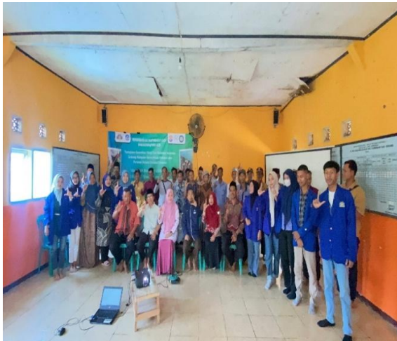
Gambar 1. Foto bersama jelang Pelatihan Penguatan Mitra Kelompok Sadar Petani Mandiri dan Mitra Kelompok Sadar Lingkungan Bersama Mahasiswa, Warga dan Aparat Desa

yang disampaikan oleh Herawati, (2025) bahwa manajemen suatu usaha adalah proses dimana suatu unit usaha merencanakan, mengatur, mengarahkan dan mengendalikan kegiatan usaha untuk mencapai tujuan dengan cara yang efektif dan efisien dalam lingkungan yang selalu berubah.