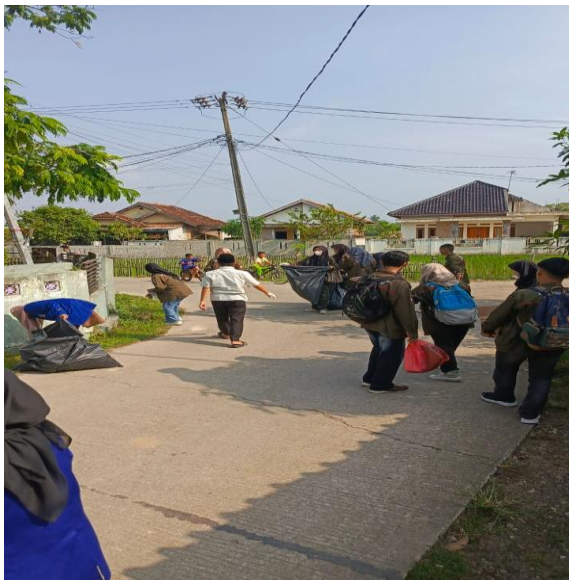
Gambar 5. Suasana Kerja Bhakti Bersama mahasiswa dan Warga

yang sudah dilaksanakan meliputi gotong royong pembuatan biopori, perbaikan posko siskamling Desa Walikukun, pembuatan kerajinan tangan dan kerja bhakti bersih Desa Walikukun. Semua kegiatan PMM ini dilaksanakan dalam rangka 1). Peningkatan efektivitas program (keterlibatan masyarakat dalam peningkatan kemandirian untuk memastikan bahwa program yang dilaksanakan sesuai dengan kebutuhan dan kondisi lokal sehingga lebih efektif dan berkelanjutan); 2). Pemberdayaan masyarakat ( keterlibatan masyarakat dapat meningkatkan partisipasi masyarakat dalam meningkatkan kesadaran, kemandirian dan kemampuan untuk mengelola sumber daya alam serta mengatasi masalah yang ada); 3). Penguatan keakraban (partisipasi masyarakat merupakan salah satu pilar penting dalam mengokohkan suasana keakraban, karena keterlibatannya dalam dalam proses pengambilan keputusan); 4). Peningkatan kesejahteraan (melalui partisipasi, masyarakat dapat lebih mudah mengakses layanan publik, memanfaatkan sumber daya alam yang ada dan meningkatkan taraf hidup masyarakat).