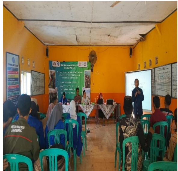
Gambar 4. Suasana Pelatihan Ecological Economics dan Pentingnya Ecological Economics Bersama Mahasiswa dan Warga