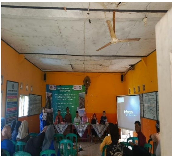
Gambar 2. Suasana pelaksanaan Pelatihan Karakteristik Desa Mandiri dan Pentingnya SDM Kreatif Bersama Mahasiswa dan Warga