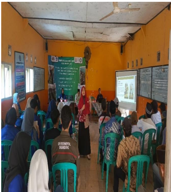
Gambar 3. Suasana Pelatihan Entrepreneur dan Entrepreneurship Bersama Mahasiswa dan Warga

Oleh karena itu, peran teknologi, kualitas sumber daya manusia, proses dan metode produksi, manajemen dan organisasi, infrastruktur dan lingkungan kerja sangat signifikan dalam mempengaruhi peningkatan produksi pertanian.