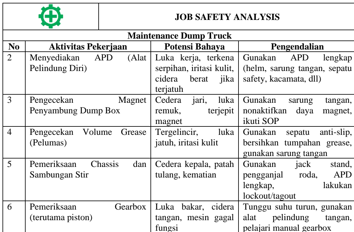
Tabel 2. (Lanjutan) Pengendalian Risiko